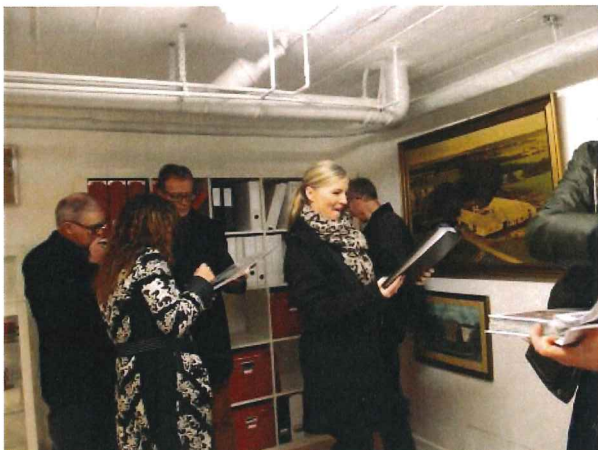
Interesserede gæster undersøger arkivmateriale.

Takket være skoleledelsens velvillige indstilling til at afgive et tiloversbleven kælderlokale til Lokalhistorisk Arkiv samt en masse praktisk arbejde af bestyrelsesmedlemmer og flere andre engagerede mennesker lykkedes det i løbet af 2013 at få klargjort det nye lokale således, at arkivets samlede areal nu er fordoblet i forhold til det oprindelige.