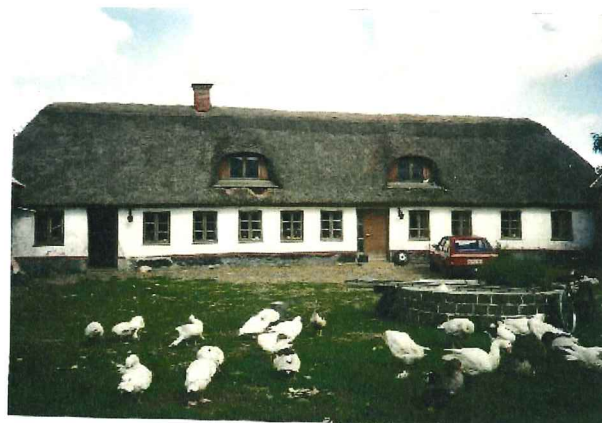
Motiv fra gårdspladsen på Himmeltvedgård, 1996.