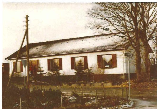
Gammelby Forsamlingshus, Gammelbyvej 35, foto fra 1980.

"Gennem flere år blev der mand og mand imellem talt en del om at bygge et forsamlingshus i Gammelby. Skytteforeningen nedsatte et udvalg til at tage sig af spørgsmålet, men det førte ikke til noget resultat. Ved et møde i Gammelby Skole nedsattes ligeledes et udvalg til at få sagen i gang, nævnte udvalget stillede den i bero – muligvis til bedre tider.