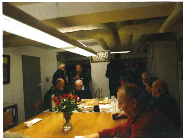
Gæster samlet i arkivets gamle, men istandsatte lokale.

I samme ombæring benyttede arkivmedarbejderne lejligheden til at istandsætte det gamle lokale samt til at omplacere en del af arkivets billeder og andre genstande, således at udstillingen nu er blevet mere overskuelig.