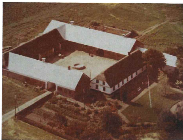
Luftfoto af Himmeltvedgård fra 1950'erne.

har selvfølgelig indgået i arbejdet. Ligeledes har de gamle boet på aftægt på gården, til de døde. Fra 1880 har der været tilknyttet en karl og en pige.