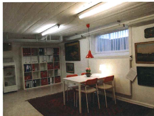
Arkivets helt nye lokale (Foto: Ida Hasring).

Indvielsesarrangementet var særdeles velbesøgt, idet det skønnes, at 70 – 80 gæster benyttede lejligheden til at se lokalerne og til at få en snak med hinanden og med os i arkivet. Arkivet er som sædvanligt åbent hver mandag formiddag eller efter nærmere aftale med et af bestyrelsesmedlemmerne. Så fik man ikke set lokalerne i forbindelse med indvielsen, er der altid mulighed for at kigge forbi på et andet tidspunkt.