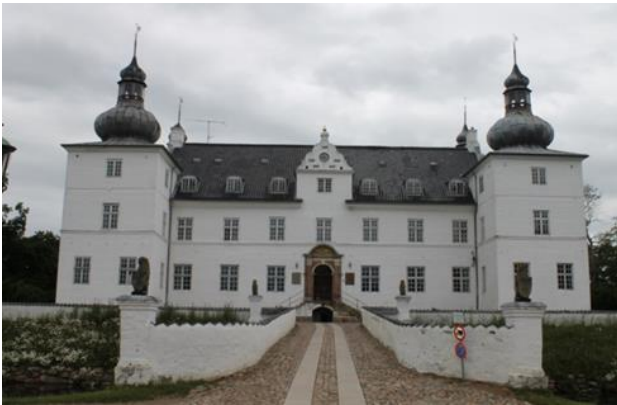
Engelsholm Slot. Til venstre ses det sydøstvendte spir, som er det eneste bevarede spir fra 1737.

hvis statelige løgformede kupler rejser sig over hvert af de fire tårne.